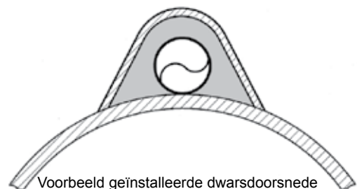
Voorbeeld geïnstalleerde dwarsdoorsnede (ChannelTrace-systeem)