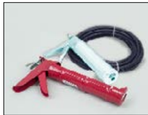
MC-1 handmatige applicator.

AC-1 cartridgeapplicator op luchtdruk met luchtslang van 50'.