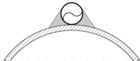
Voorbeeld geïnstalleerde dwarsdoorsnede (Gebogen toepassing)